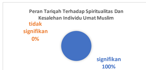
Gambar 2. Peran Tarekat Terhadap Spiritualitas Dan Kesalehan Individu Umat Muslim

Badawiyah, Chistiyah, Dasuqiyah, dan lain-lain. Tujuan utama Tarekat adalah untuk memperbaiki diri dan berjalan di jalan yang di ridhoi Allah SWT. Penggunaan Tarekat juga dapat berdampak pada perkembangan kehidupan manusia dan masyarakat, termasuk perkembangan spiritual umat (Hasanah et al., 2023). Artinya, terdapat pengaruh yang sangat signifikan dari peran Tarekat terhadap spiritualitas dan kesalehan individu umat muslim di Indonesia, sebagaimana tersaji secara rinci pada gambar di bawah ini: