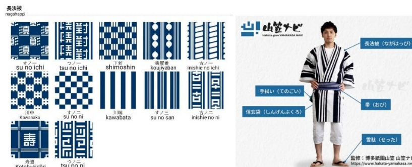
Gambar 2. motif nagahappi Daikoku-ryu

Sebagai identitas, masing-masing nagare memiliki motif nagahappi (pakaian formal bagi para peserta festival) dan mizuhappi (mantel katun tipis) yang digunakan selama 15 hari pelaksanaan festival. Dikutip dari situs resmi penyelenggara Yamakasa, pada gambar 2 dan gambar 3 menunjukkan contoh motif yang digunakan pada nagahappi dan simbol yang tertulis di mizuhappi milik Daikoku-ryu. Para peserta dari masing-masing nagare menggunakan motif dan simbol ini menjadi salah satu bagian dari identitas mereka. Dengan mengenakan seragam, anggota kelompok menunjukkan identitas kolektif dan mencerminkan norma kelompok dan aturan yang harus diikuti sebagai bagian dari kelompok yang merupakan penerapan dari shuudan seikatsu . Melalui penggunaan seragam menunjukkan bahwa mereka setuju untuk bergabung dalam kelompok dan melepaskan identitas pribadi mereka. Hal ini juga menunjukkan semangat solidaritas yang membangun ikatan dan kebanggaan kolektif di antara pemakainya yang juga menjadi pengamalan shuudan shikou . Seragam menjadi perwujudan simbol dari tradisi dan kebersamaan dan memperkuat rasa memiliki di antara anggota yang menurut interaksionisme simbolik merupakan bentuk objects atau objek. Melalui pemakaian seragam secara bersamaan juga menciptakan kesan visual yang kuat mengenai solidaritas dan kesatuan kelompok yang dalam interaksionisme simbolik merupakan tindakan bersama atau joint action .