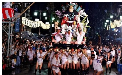
Gambar 1. Kakiyama