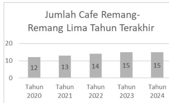
Gambar 1. Perkembangan Kafe Remang-Remang Selama Periode Tahun 2020-2024 di Kecamatan Kampar Kiri Sumber: Stuan Polisi Pamong Praja Kabupaten Kampar, 2024